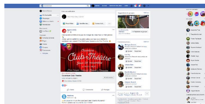
Page d'accueil de Facebook

LinkedIn a adopté cette mise en page afin de mettre les utilisateurs de leur site dans un milieu connu, puisque la majorité des membres ont plus de 34 ans (environ 79%) et sont donc pour la plupart présents et utilisateurs de Facebook.